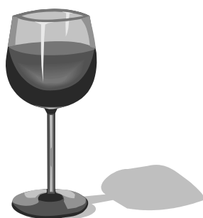
100 ml wina 10%