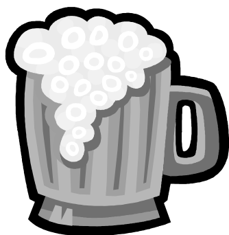
200 ml piwa 5%